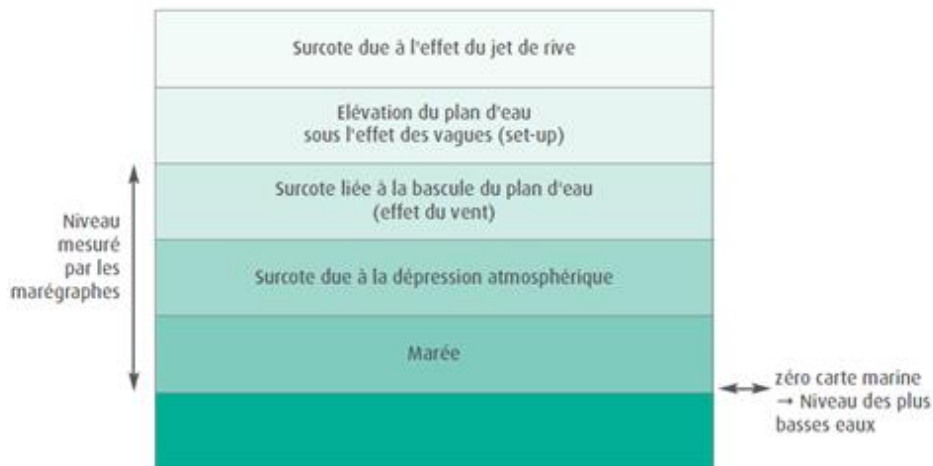
Figure 3 - Facteurs constituant un niveau d'eau.