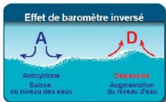
Figure 2 - Les effets du baromètre inverse.

Un des principaux facteurs contribuant à la surcote est la pression atmosphérique* ( Figure 2 ). La pression moyenne au niveau de la mer est de 1013 hPa. (voir fiche "Pression atmosphérique" ). Selon la règle du baromètre inverse, si la pression atmosphérique augmente (ou diminue) d'un hectopascal à échelle locale, il en résulte respectivement une diminution (ou une augmentation) du niveau de la mer d'un centimètre (Ponte, 2006; Woodworth et al., 2019; Wunsch & Stammer, 1997) :